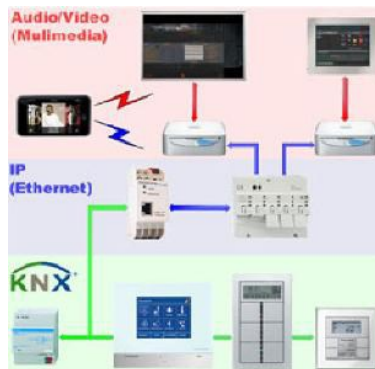
Ex. på multimedia lösning med KNX