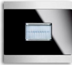
priON 1 fack GLS BW