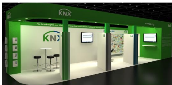
KNX Sweden visar en helt ny monterlayout på Elfack 2011