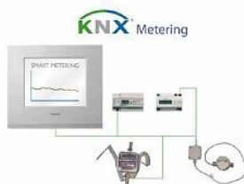
Ex. på mätning med KNX

Välkommen till ett Elfack som du aldrig har sett tidigare!!